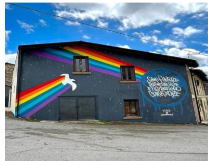
Aielli (Abruzzo): il Festival Borgo Universo e la street art astronomica