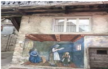
Cibiana di Cadore (Veneto)