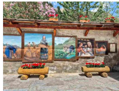
Usseaux (Piemonte): Il borgo delle fiabe e delle tradizioni