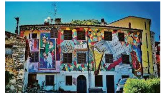
Sant'Angelo Le Fratte (Basilicata)