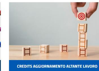
CREDITS AGGIORNAMENTO ATLANTE LAVORO