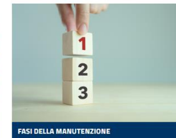
FASI DELLA MANUTENZIONE

Per saperne di più della procedura di manutenzione