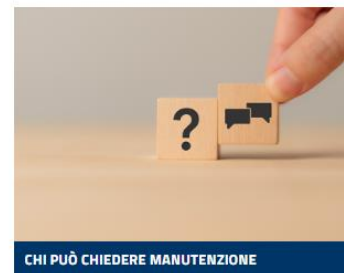
CHI PUÒ CHIEDERE MANUTENZIONE

Clicca uno dei riquadri sottostanti per approfondire