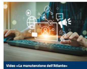
Video «La manutenzione dell'Atlante»

Per saperne di più della procedura di manutenzione