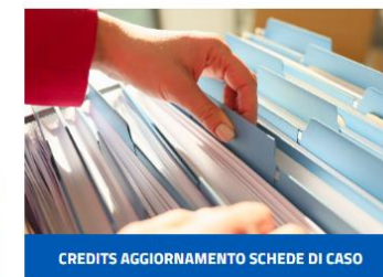
CREDITS AGGIORNAMENTO SCHEDE DI CASO