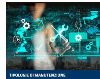
TIPOLOGIE DI MANUTENZIONE