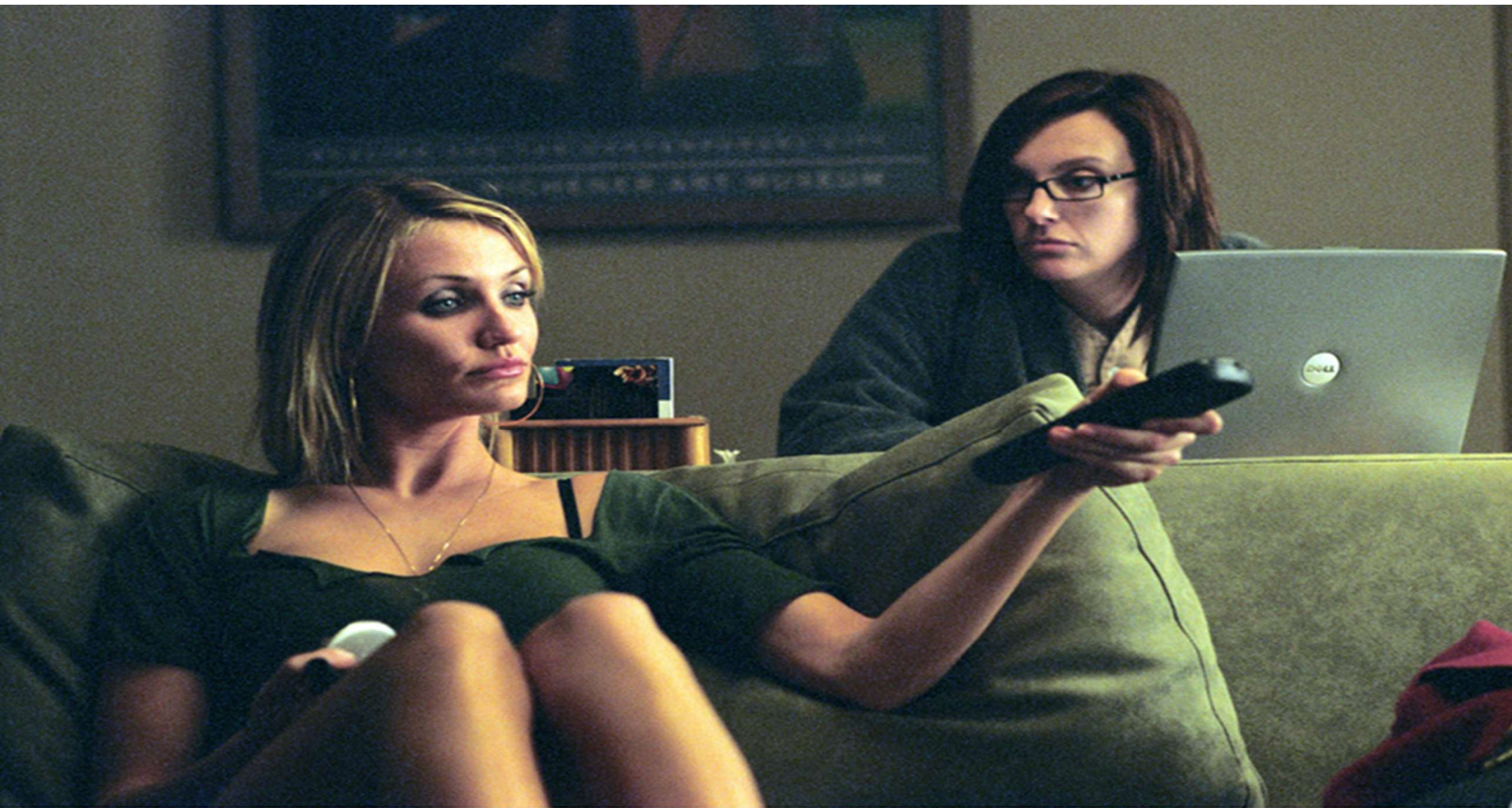
IHS-42 IN HER SHOES is the alternately hilarious and heart-rending story of two sisters, Maggie (Cameron Diaz, left) and Rose Feller (Toni Collette), with nothing in common but size 8 _ feet.