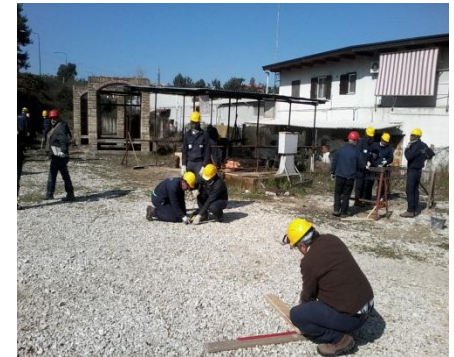
Sessione di accertamento CFME - Napoli

Il Repertorio Formedil è già fortemente ECVET compatibile e con pochi adattamenti utilizzabile per ottimizzare le qualificazioni di settore ai fini della mobilità e del riconoscimento.