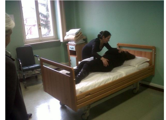
Sessione di accertamento Engim - Torino

Il sistema di partenza è fortemente ECVET compatibile: con adattamenti minimi si perviene a prassi condivise a livello europeo